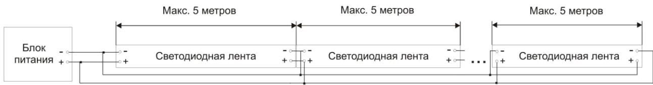
Схема подключения RGB ленты: